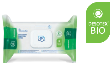
DESCOCEPT SENSITIVE WIPES