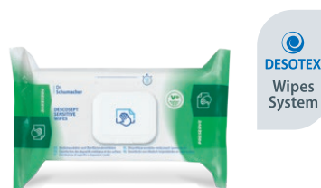
DESCOCEPT SENSITIVE WIPES