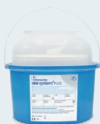
ONE SYSTEM+ PLUS