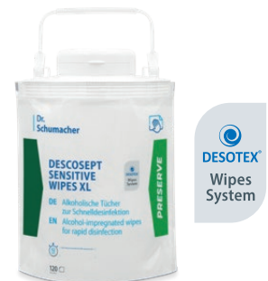
DESCOCEPT SENSITIVE WIPES XL

DESCOCEPT SENSITIVE WIPES sind alkoholische, gebrauchsfertige Tücher zur materialschonenden Desinfektion und Reinigung von Medizinprodukten, medizinischem Inventar sowie Flächen aller Art in patientennahen Bereichen.