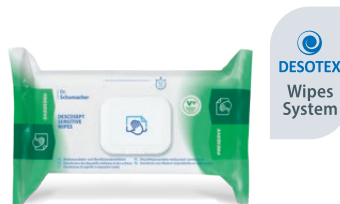
DESCOCEPT SENSITIVE WIPES